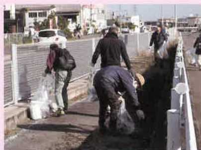
和泉黄金塚古墳周辺クリーンアップツアー

市街地できちんと捨てられなかったペットボトルやプラスチックごみが川から海に流れ出ること、海にはたくさんのプラスチックごみが集まっています。これは海の生態系に悪影響を与えることがわかりつつあり、その対策が急がれています。泉北クリーンセンターでは地域清掃活動、スポGOMI大会、和泉黄金塚古墳周辺クリーンアップツアーなどを実施し、森里川海プロジェクトやプラスチックスマートに賛同するなど市民の皆様と清掃活動を行っています。