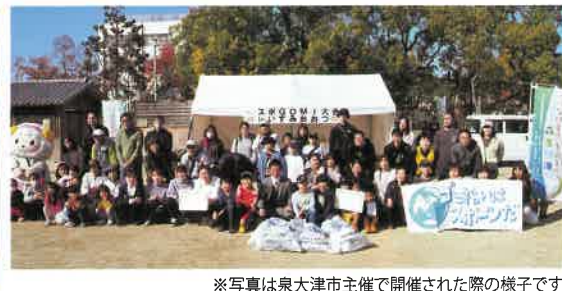
※写真は泉大津市主催で開催された際の様子です