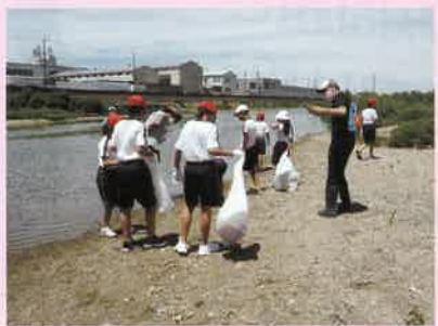
泉大津市主催の水辺の学校