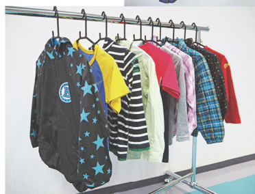
※出品品は変更になる可能性があります。