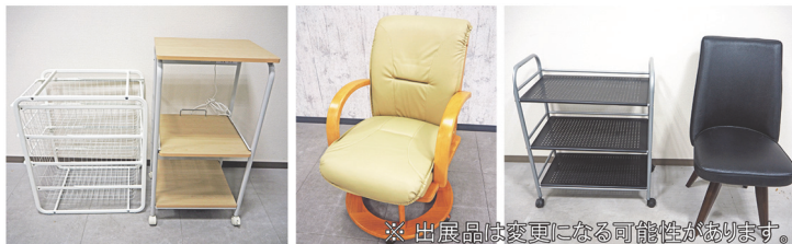
※ 出品品は変更になる可能性があります。