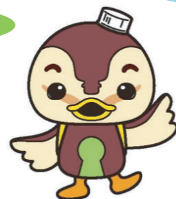
※泉北環境マスコットキャラクター「とろすけ」

また、二酸化炭素（CO 2 ）の削減にも寄与し、企業の社会的責任をはたすことができます。